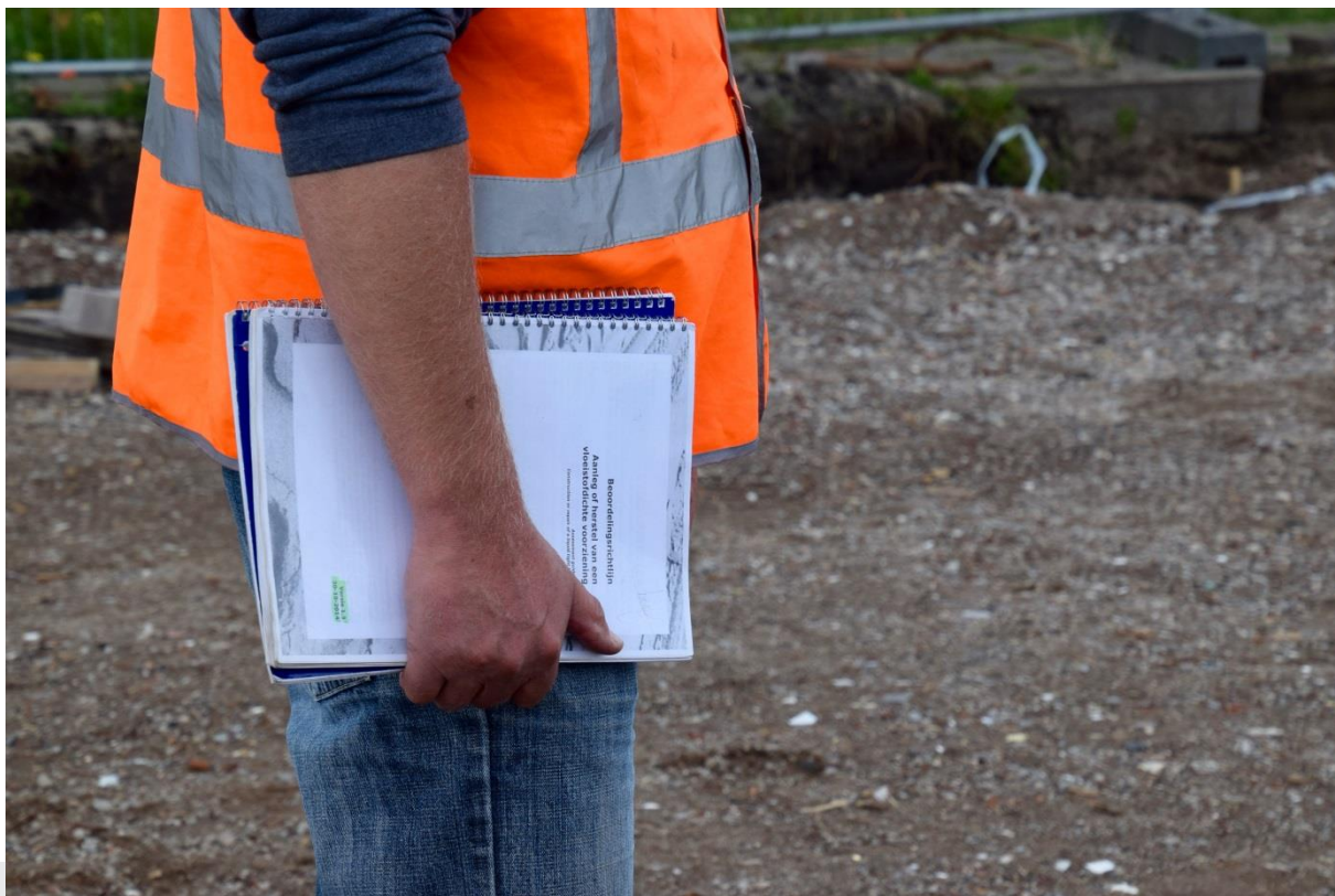
Foto: Toepassen BRL in praktijk

De aannemer mag aan één persoon meerdere functies toekennen.