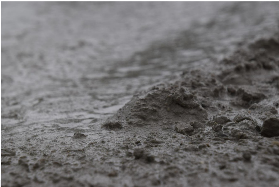
Foto: Detail betonmortel.

De certificatie-instelling past in elk van de hieronder beschreven situaties de daarbij vermelde sanctie toe. De certificatie-instelling meldt een afwijking altijd schriftelijk aan de aannemer.