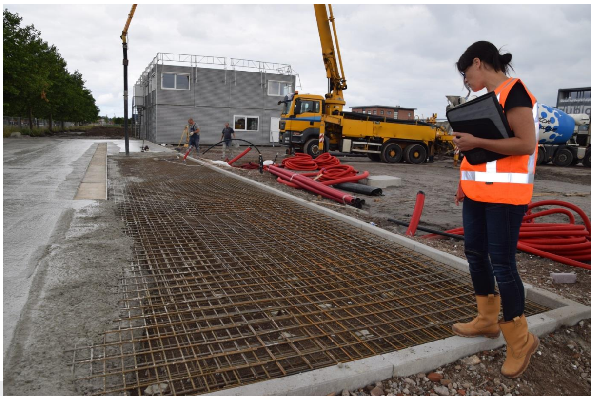
Foto: Kwaliteitscontrole van het werk

Ook bij herstel bepaalt de opdrachtgever door middel van een programma van eisen de criteria en controleert de aannemer vooraf of aan de gestelde eisen kan worden voldaan. Feitelijk is er in deze beoordelingsrichtlijn wat betreft werkwijze en systematiek geen verschil tussen aanleg en herstel van een vloeistofdichte voorziening.