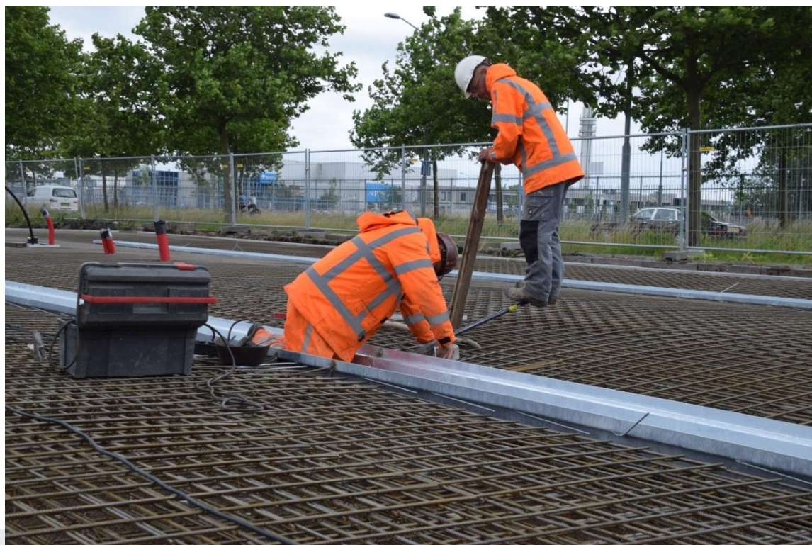
Foto: Aanleg wapening voorziening.

Wat betreft de aanduiding 'kan komen' gelden beperkingen qua tijd en voorwaarden bij het gebruik en de wijze van onderhoud van de voorziening. De aannemer informeert de opdrachtgever schriftelijk over deze beperkingen en voorwaarden, zie paragraaf 4.20.