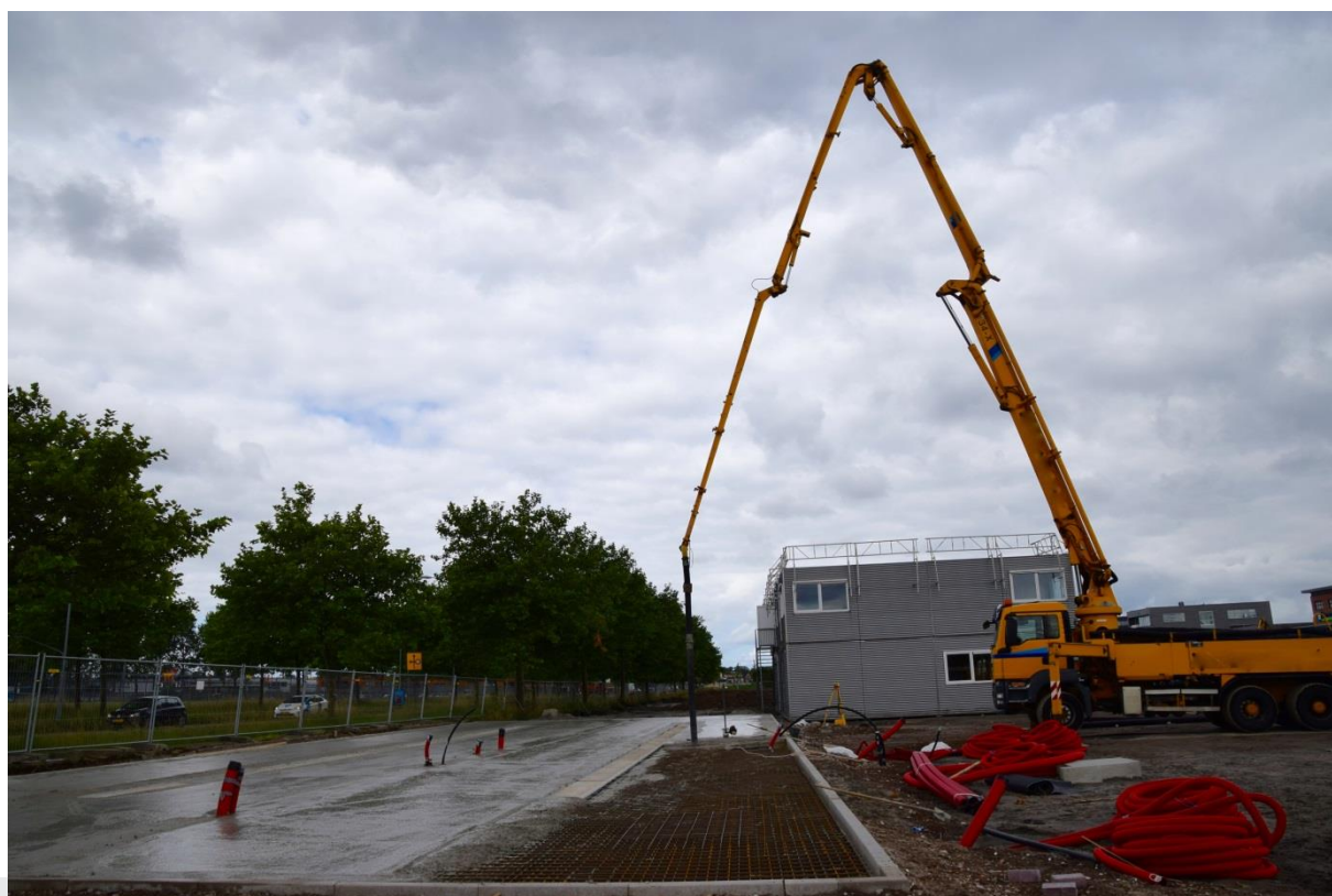
Foto: Storten van een voorziening.